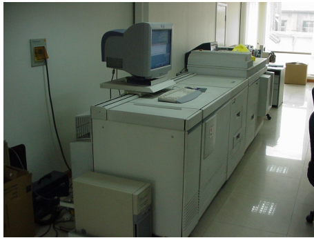
没有联网的 POD 生产线

“按需打印”（Print-On-Demand, POD）是最近几年出现的新技术。这里的“按需”是指按照需要的拷贝数量打印文档和出版出版物。有专家进行过统计，80%以上的文档的印刷数量少于500册，有些技术会议的会刊资料可能连100本都用不到。真正可以达到3,000册的文档可以按照书出版发行的情况并不多见。为了解决这一矛盾，POD技术应运而生。下面就是这么一种POD设备的图片。