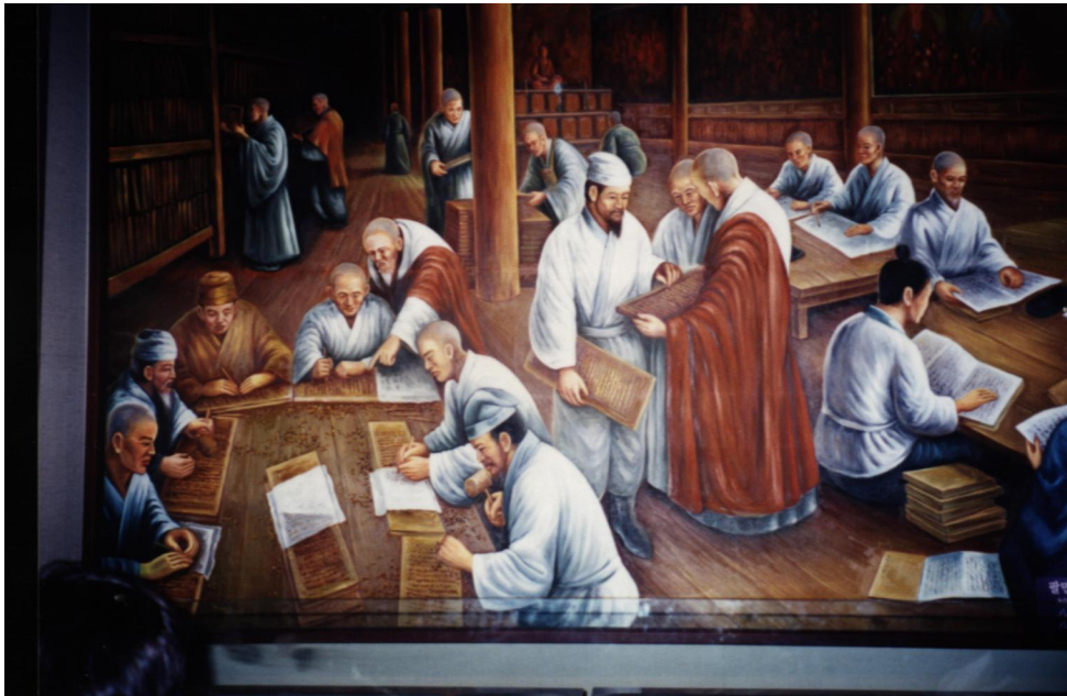
图 1 古朝鲜的印刷作坊

下面是笔者于 2000 年访问韩国汉城时，在当地的博物馆拍摄的一张照片，这幅图片重现了古代印刷厂工人工作的情景。朝鲜古代的印刷术是从中国传入的，因此我们可以利用这幅图片联想中国古代印刷作坊的情形。值得一提的是，毕升使用的是用火烧制的泥活字，后人再改用木活字，而朝鲜是首次利用金属制造活字的国家。金属活字虽然造价比木活字昂贵，但是活字的使用寿命大为提高，而且金属活字嵌入到版面夹具之后不易松动，可以提高印刷质量。金属活字在印刷工业界一直使用到上个世纪。因此朝鲜人民也为人类印刷术的进步作出了很大贡献。