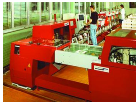
已经联网的 POD 生产线